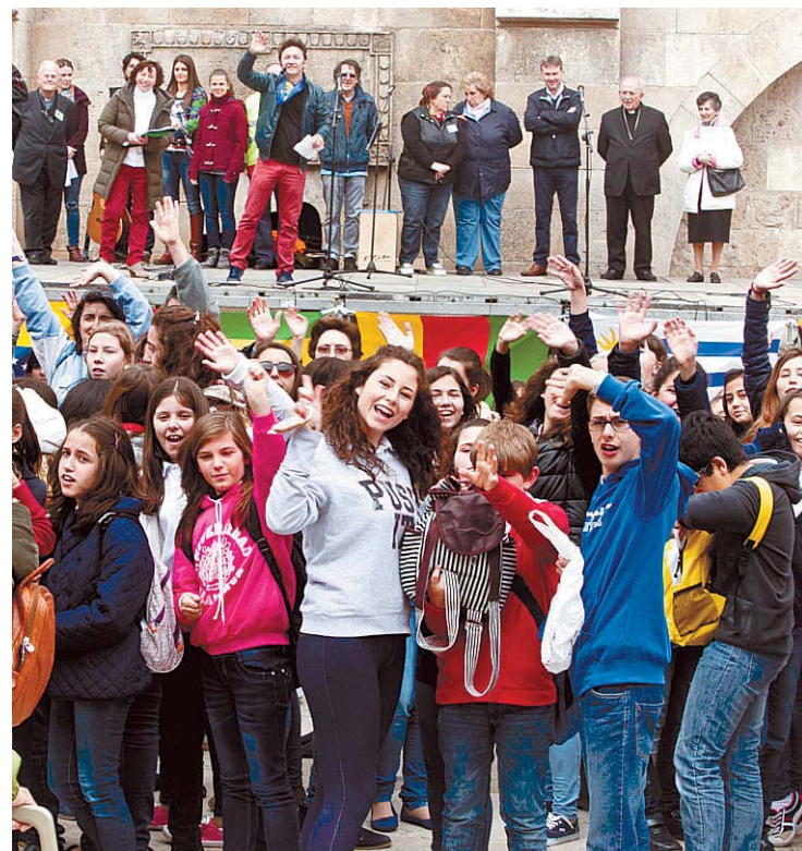
El acto de bienvenida tuvo lugar en la Plaza del Rey San Fernando.

Allí el alcalde y el arzobispo saludaron a los llegados desde otras diócesis españolas y les invitaron a aprovechar su estancia en la ciudad pese a la mañana más que fresca que pesaba sobre ellos. Ajenos a la climatología, ya por la tarde los chavales se repar-